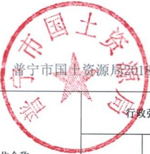
普宁市国土资源局2018年度行政强制实施情况统计表（盖章）