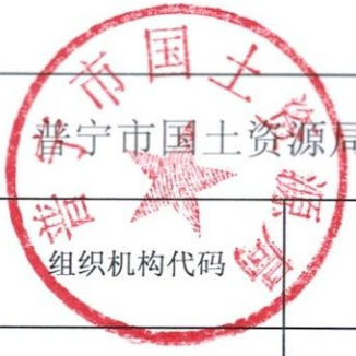
普宁市国土资源局2018年度行政征用实施情况统计表（盖章）