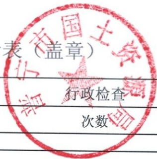
2018年度行政检查实施情况统计表（盖章）