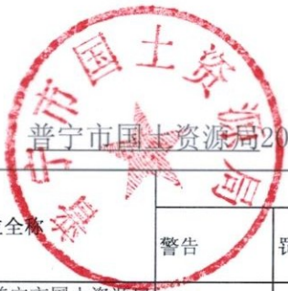
普宁市国土资源局2018年度行政处罚实施情况统计表（盖章）